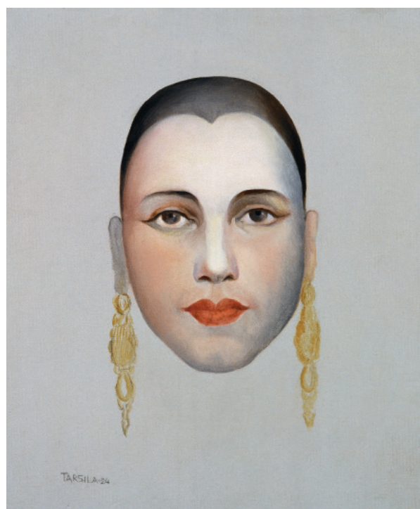
Tarsila do Amaral. Autorretrato I, 1924. Óleo sobre tela. Acervo dos Palácios