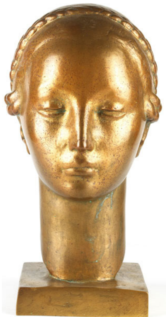
Galileo Emendabili. Cabeça de donzela, séc. XX. Bronze. Acervo dos Palácios.

Um dos gêneros artísticos mais conhecidos é o retrato! Na coleção dos Palácios há retratos feitos em pintura, desenho, gravura e escultura. Galileo Emendabili adorava fazer retratos em bronze, representando apenas a cabeça do retratado. Tarsila do Amaral também usou a mesma ideia para fazer o seu próprio rosto.